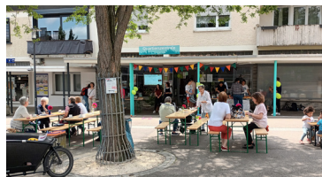
Tag der Nachbarn am 26. Mai 23

Seit März wird die Quartierszentrale vom Oberlin e.V. geleitet. Es gibt bereits viele feste Angebote, aber auch noch freie Zeiten, wo diese nicht geöffnet